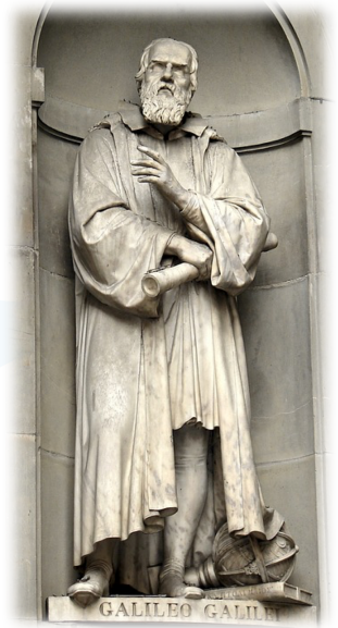
Statua di Galileo Galilei di Aristodemo Costoli

Il metodo scientifico consiste nella raccolta di dati tramite l'osservazione e l'esperimento al fine di formulare ipotesi e teorie. Il metodo scientifico è la modalità con cui la scienza indaga sulla realtà ed è il metodo più affermato nel processo di definizione della conoscenza. La moderna concezione di metodo scientifico si deve a Galileo Galilei che per primo afferma l'importanza della sperimentazione empirica e della dimostrazione matematica per spiegare qualsiasi fenomeno naturale osservabile nella realtà empirica.