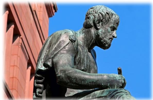
Aristotele: statua di bronzo presso l'Università di Friburgo.

Il metodo deduttivo è un processo conoscitivo dal generale al particolare. Nel modello deduttivo lo scienziato parte dai principi generali per arrivare all'enunciazione di leggi in grado di spiegare fenomeni particolari. Il procedimento deduttivo che conduce dal generale al particolare è basato sul ragionamento e sulla logica. Il metodo deduttivo è contrapposto al metodo induttivo, entrambi i metodi sono conosciuti già dai primi filosofi greci. Il filosofo greco Aristotele utilizza il metodo deduttivo per costruire il concetto del